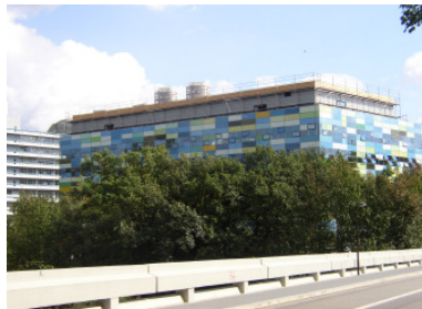
ZMB im neuen BioMedizinZentrum Bochum